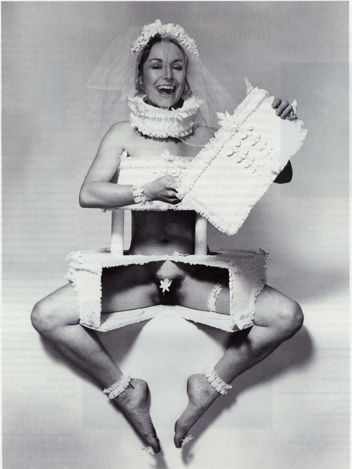
Penny Slinger, Wedding Invitation -2 ( Art is Just a Piece of Cake ), 1973, © Penny Slinger / Courtesy: Gallery Broadway 1602, New York / SAMMLUNG VERBUND, Wien