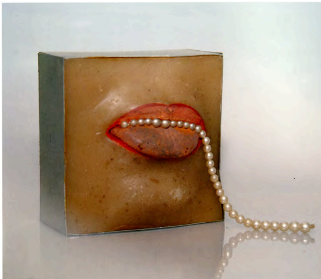
Penny Slinger Teeth like Strings of Pearls, 1973 8,6 x 8,6 x 8,6 cm